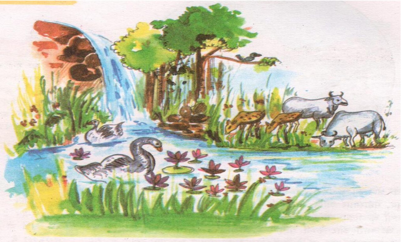
चित्रम् – 1.3 तडागस्य पारितन्त्रम्

कथायाः बालाः इव भवन्तः अपि स्वकीय-पर्यावरणीय-स्थानस्य चित्रम् आनयन्तु ।