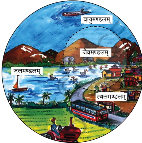
चित्रम् 1.2 पर्यावरणस्य क्षेत्रम्

स्थलमण्डलं तत्क्षेत्रं भवति, यत् अस्मभ्यं वनं, कृषिं तथा च मानवानाम् आवासाय भूमिं, पशूनां चारणाय घासस्थलं ददाति । एतत् खनिजसंपदायाः अपि एकं स्रोतम् अस्ति ।